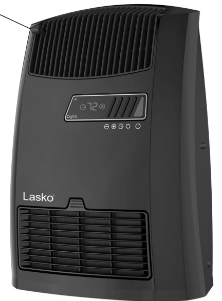
Función De Persiana